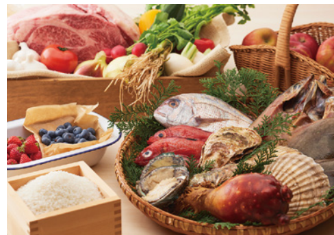
東北で育まれた食材を活かした、多彩な料理をご堪能いただけます。

つややかなお米に、新鮮な魚介類。大事に育てられた野菜たちや、ジューシーな肉類。豊かな自然に抱かれる東北は、おいしい山海の幸や、大地の恵みの宝庫です。四季折々に旬の味覚があり、その土地ごとに、地元で親しまれてきた郷土の味がたくさんあります。仙台を訪れたなら、ぜひ2つの飲食店で、東北ならではのさまざまなおいしさをお楽しみください。「DUCCA 仙台駅前」「亜門」では、それぞれメニューは異なるものの、いずれも東北産の食材を使い、地産地消をコンセプトにした料理をご用意しています。素材そのものの味わいを大切にシンプルな味付けのものから、初めて食べるはずなのにどこか懐かしい味がする東北各地の郷土料理、そして