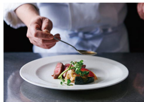
団体のお客さま一人ひとりへ、上質な料理とサービスをご提供します。

仙台には、さまざまなおいしいものがあります。たくさんのお客さまもいます。でも、数十名～100名を超える団体のお客さまを、ひとつの空間でおもてなしできる飲食店は、なかなかありません。ビジネスや観光で仙台を訪れていただく団体のお客さま。せっかくなら空間を隔てることなく、ここでしか味わえないおいしさと語りを楽しみたい。その思いに、CFSの運営する大規模飲食店がお応えします。仙台駅の近くにある、最大220名までフロア貸切が可能な「DUCCA 仙台駅前」。そして多くの飲食店が軒を連ねる国分町には、60名まで着席可能なパーティールームを備えた「亜門」。仙台でも主要な場所にある2つの店舗が、開放的な空間とおいしい料理の数々で、団体のお客さまをおもてなしします。