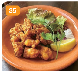
35 タコの唐揚げ 550円