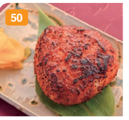
50 仙台味噌の焼きおにぎり (大) 450円