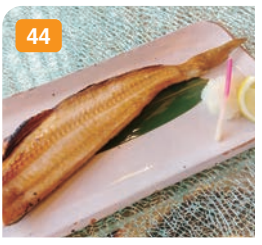
44 トロほっけ一夜干し炙り 850円