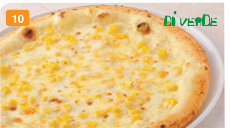
10 コーンマヨナーラ マヨネーズソース・モッツアレラ・たっぷりコーン 1,400円