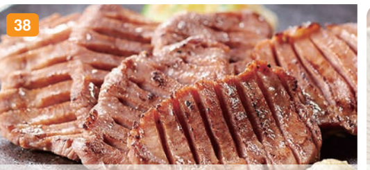
38 厚切り牛タン炭火焼き 店長一押し! 仙台名物の牛タンを定番の塩味を炭火でジューシーに焼き上げました。 1,650円