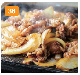
36 十和田バラ焼き 800円