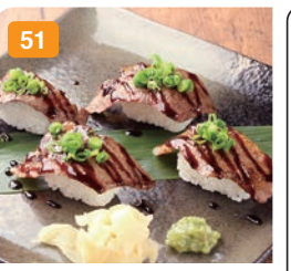
51 登米産日高見牛のサーロイン炙り肉寿司 (4貫) 1,600円