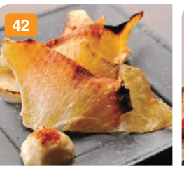
42 エイヒレの炙り 700円