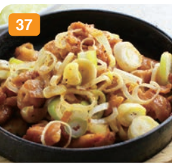
37 気仙沼ホルモン焼き 950円