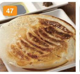
47 フカヒレ焼き餃子 (5個) 気仙沼産フカヒレを使用したコラーゲンたっぷり濃厚な味わい。 700円