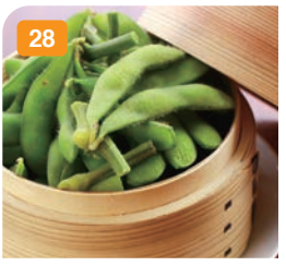
28 枝豆 500円