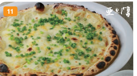
11 亜門ピッツァ 蔵王すずしろ産生湯葉とモッツアレラチーズのハーモニーは最高です。ワサビ醤油で召し上られ。 1,400円