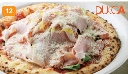
12 DUCCA ピッツァ 登米市伊豆沼伊達の純粋赤豚ジャンボランとルッコラを使用。さらにふんだんにペコリーノをかけて。 1,800円