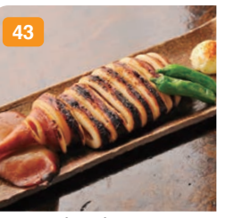
43 イカのぼっば焼き 肉厚のスルメイカに高砂長寿醤油をつけて、じっくりと焼き上げました。 850円