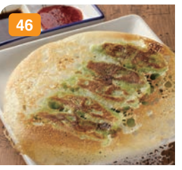
46 青葉焼き餃子 (5個) 特産の雪菜を皮に練りこんだ、宮城の御当地餃子です! 650円