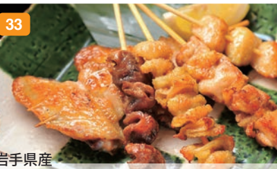
33 岩手県産 いわい鶏の串焼き盛り合わせ6種【伊達の旨塩】 【もも/ささみ/皮/ぼんじり/砂肝/手羽先】 炭火でじっくり焼き上げました。赤穂塩が旨みを引き立てます。 1,500円