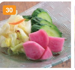
30 お新香盛り合わせ 600円