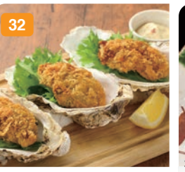
32 三陸産大粒牡蠣フライ (3個) 850円