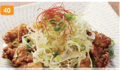
40 森林鶏の唐揚げ 特製ダレに漬け込んだ宮城県産森林鶏の唐揚げ。 850円