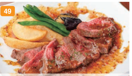
49 登米産日高見牛のソテー 粒マスタードソース サラダのように毎日食べたい、良質な脂身の黒毛和牛。 1,700円