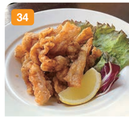
34 ナンコツ唐揚げ 600円