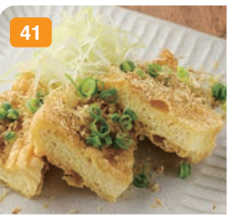
41 定義山の三角揚げ焼き 宮城県でも有名な三角揚げの一つ。 750円