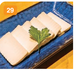
29 クリームチーズの味噌漬け 750円