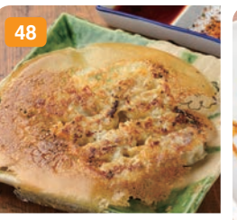
48 牛タン入り焼き餃子 (5個) 仙台名物牛タンと餃子のコラボ 750円