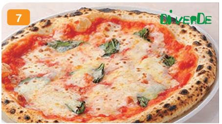
7 蔵王モッツアレラチーズのマルゲリータ 蔵王産モッツアレラチーズ・トマトソース・バジル 1,500円