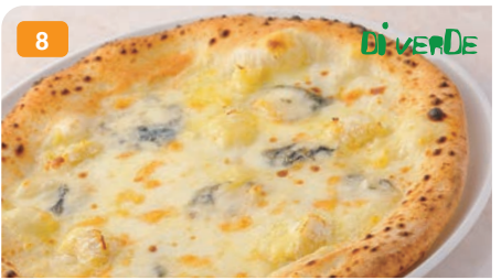
8 クワトロフォルマッジ モッツアレラ・コロゴンゾーラ・パルメザンチーズ・ステップチーズ 1,500円