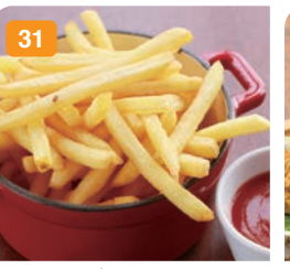
31 フライドポテト 500円